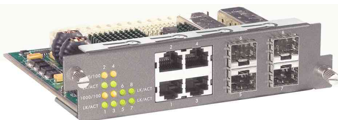
Module RJ45 1000BaseT + mini GBIC pour GSW-2453