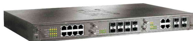
Switch modulaire 19" non manageable Gigabit Ethernet, 3 anneaux