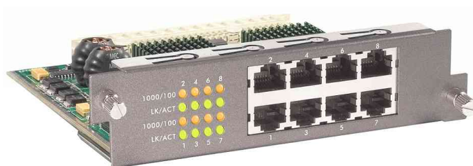
8 modules RJ45 1000BaseT pour GSW-2453