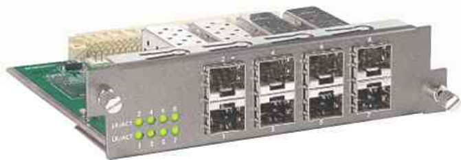
8 anneaux de module SFP (miniGBIC) pour GSW-2453