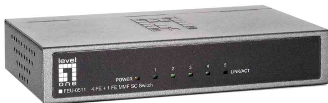
Desktop Fast Ethernet Switch FEU-0511, 4 + 1 Port MMF SC